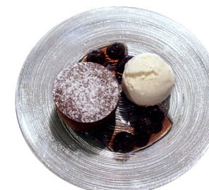
Moelleux au chocolat, griottes et glace vanille (10 min)