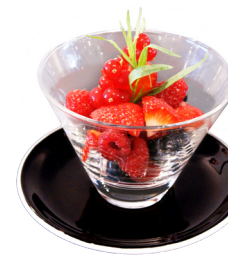
Coupe de fruits rouges, en saison

Meringue XL, crème de Gruyère, coulis de framboises 16.-