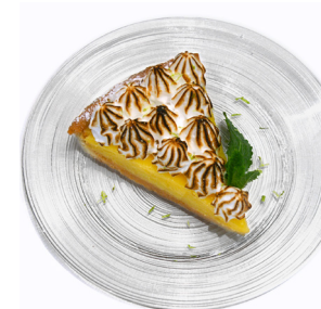
Tarte au citron / meringuée