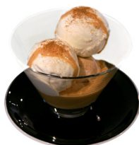
Trilogie de crèmes glacées

1b. vanille, 1b. café, sauce au café, chantilly 12.-