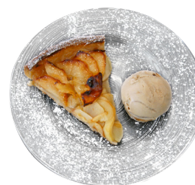
Tarte aux pommes et sa glace cannelle