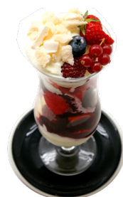
Sunny Swiss Touch*

1 b. vanille, 1b. yahourt, 1b. cannelle nappées de caramel au beurre salé 15.-