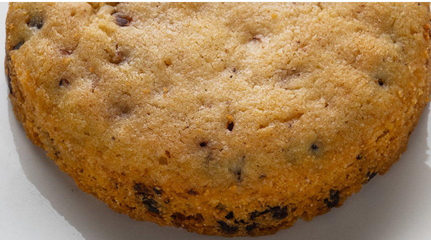
Cookie aux pépites de chocolat