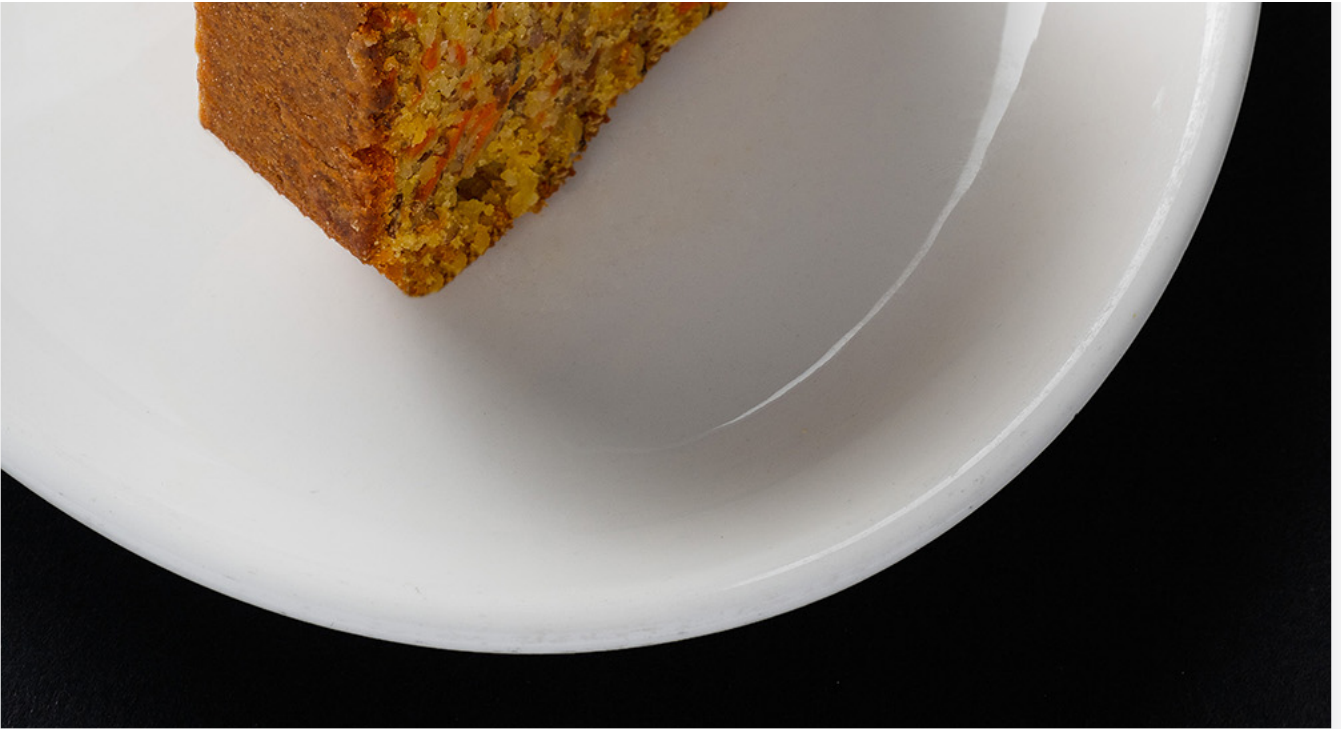
Notre délicieux Carrot Cake "fait maison"