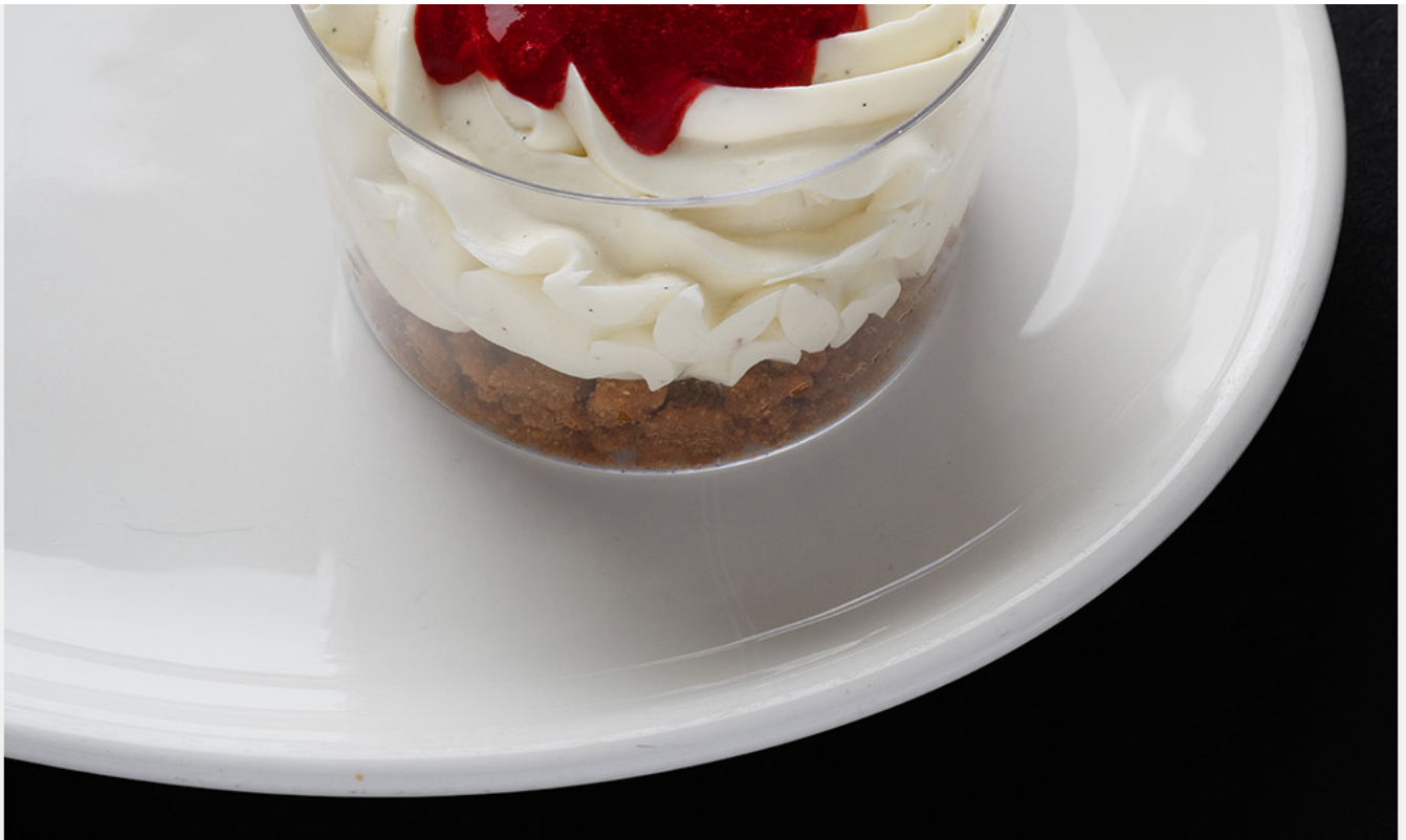
Cheesecake cru à la framboise "fait maison"