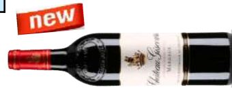
CHÂTEAU GISCOURS 2012 75 CL € 85,50