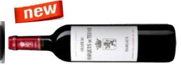
MARQUIS DE TERME 2009 75 CL € 72,00