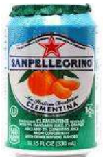
CLEMENTINA 24 X 33 CL € 21,50 CS