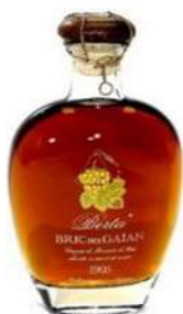
BRIC DEL GAIAN