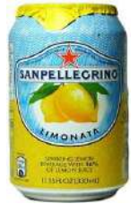
LIMONATA 24 X 33 CL € 21,50 CS

Située dans la province de SAN PELLEGRINO TERME de Bergame (Lombardie), la société San Pellegrino a été fondée en 1899. L'eau minérale a été produite pendant 600 ans, Leonardo da Vinci a visité la ville en 1509 pour examiner «l'eau miraculeuse» pour ensuite rédiger un traité sur le sujet, En 1970, la société San Pellegrino est devenue leader en Italie dans l'industrie des boissons, La société continue de se développer, et en 1988, San Pellegrino est devenue la première marque italienne d'eau minérale exportée vers la France, Plus de 65 000 bouteilles sont vendues chaque jour dans les restaurants de NEW YORK, aujourd'hui San Pellegrino est présent dans plus de 135 pays dans le monde