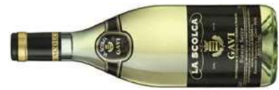
GAVI DI GAVI BLACK LABEL DOCG 100 % Cortese 2018 75 CL € 32,00 2019 Magnum € 72,00