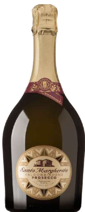
SANTA MARGHERITA BRUT MAGNUMI € 31,00