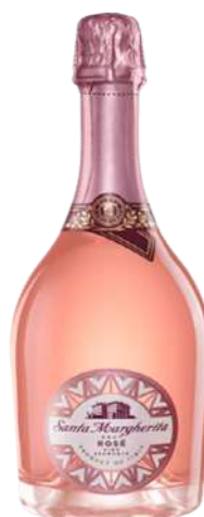
SPARKLING ROSE 75 CL € 13,20