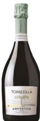
TORRESELLA 75 cl € 9,30