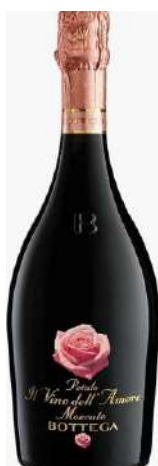
BOTTEGA PETALO MOSCATO 75 CL € 10,20