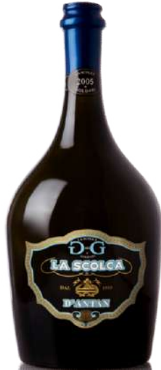
GAVI D ANTAN DOCG 100 % Cortese 2007 75 CL € 0,00