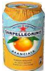
ARANCIATA 24 X 33 CL € 21,50 CS