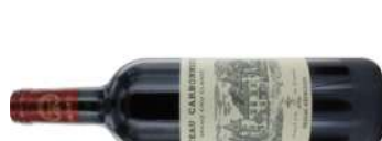
CARBONNIEUX 2014 75 CL € 55,00