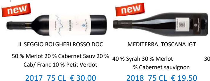
IL SEGGIO BOLGHERI ROSSO DOC

La valeur et la qualité exceptionnelles de la région, ainsi que notre expertise et notre expérience, ont transformé Poggio al Tesoro en une réalité: nous produisons des vins avec une personnalité distinctive, exprimant puissance et complexité ainsi qu'élégance et profondeur. Après seulement quelques années et beaucoup de travail acharné, Poggio al Tesoro est maintenant un domaine prospère de 70 hectares (173 acres) dans le territoire viticole de Bolgheri.