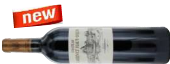
LARRIVET HAUT BRION 2014 75CL € 52,00