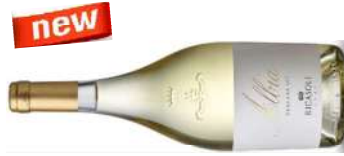
ALBIA BIANCO TOSCANO IGT Sauvignon Blanc - Chardonnay Malvasia Bianca 2019 75 cl € 12,00