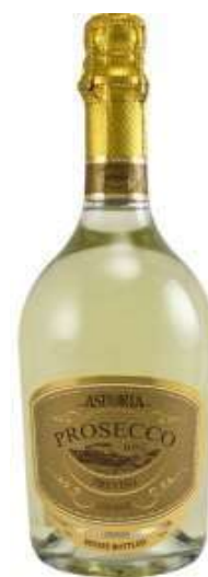
ASTORIA 75 cl € 9,30