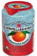
ARANCIATA ROSSA 24 X 33 CL € 21,50 CS