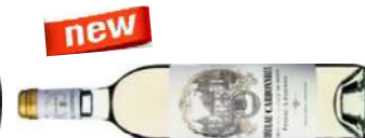
CARBONNIEUX BLANC 2015 75 CL € 48,00