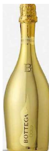
BOTTEGA GOLD 75 CL € 22,00