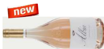
ALBIA ROSE TOSCANO IGT Sangiovese - Merlot 2019 75 cl € 12,00

Château de Brolio: symbole du territoire de la région du Chianti Classico Ricasoli est le producteur de vin le plus représentatif de la région du Chianti Classico. Avec ses douces collines, ses vallées veloutées et ses bois épais de chênes et de châtaigniers, les 1200 hectares de propriété comprennent près de 240 hectares de vignes et 26 d'oliviers. Cela crée une succession continue de couleurs et de teintes autour du château de Brolio, qui est situé dans les limites de la ville de Gaiole in Chianti. Depuis 1993, le baron Francesco Ricasoli guide cette entreprise toscane centrale dans des défis innovants. Cela a été fait avec le plus grand respect pour ses ancêtres de renom qui ont fait de ce territoire un grand territoire, Bettino Ricasoli avant tout.