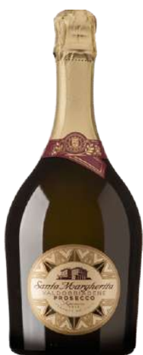
SANTA MARGHERITA BRUT 75 cl € 13,20

Dès 1969 , le Prosecco produit à Conegliano Valdobbiadene a reçu l'Appellation d'Origine Contrôlée italienne. Depuis 2009 , il est passé DOCG qui est la plus haute reconnaissance pour les vins italiens, impliquant le changement de nom "Conegliano Valdobbiadene Prosecco Superiore".